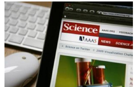
Acheter certains médicaments en ligne pourrait devenir légal.

Ce type d'information ne jouit pas globalement